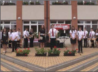
Búcsúznak a nyolcadikosok 6. oldal