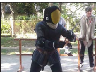
VII. Középkori Forгатag 9. oldal