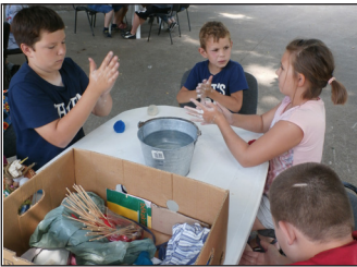
Szivárvány tábor 7. oldal