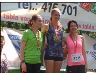
A nyár bajnokai 11. oldal