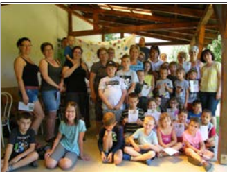
Táboroztak az ovisok 8. oldal