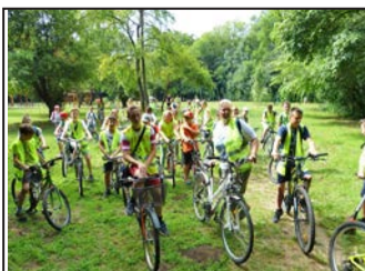
Színes iskolai hírek 10. oldal