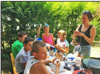
Szivárvány Tábor 2019 5. oldal