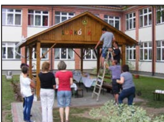
Huszonöt év a gyerekekért 11. oldal