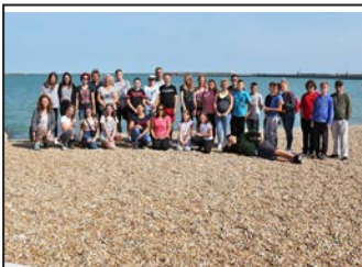
Újra Londonban jártunk! 3. oldal