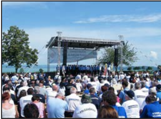
Országos Polgárőr Nap 2. oldal