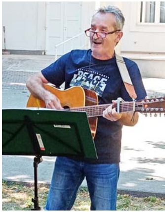
2023. július 8-án ünnepelte megalakulásának 10 éves

évfordulóját az Ebesi Hagyományörző Egyesület.